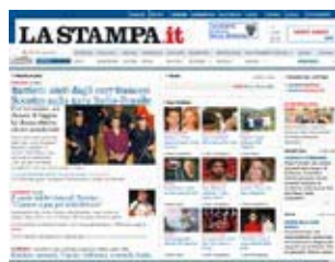
La home page del sito LaStampa.it

La collaborazione tra K Group e La Stampa ha portato all'introduzione su LaStampa.it delle novità di Internet Explorer 8: WebSlice e Accelerator. Si tratta di applicazioni sviluppate da K Group, che consentono ai lettori di LaStampa.it di accedere alle informazioni presenti sul sito in maniera rapida e semplice e di ricercare più facilmente le informazioni di proprio interesse. K Group è la prima realtà italiana che ha recentemente proposto al mercato i nuovissimi WebSlice e Accelerator per Internet Explorer 8, raggiungendo in poco tempo obiettivi ambiziosi e riafferman-